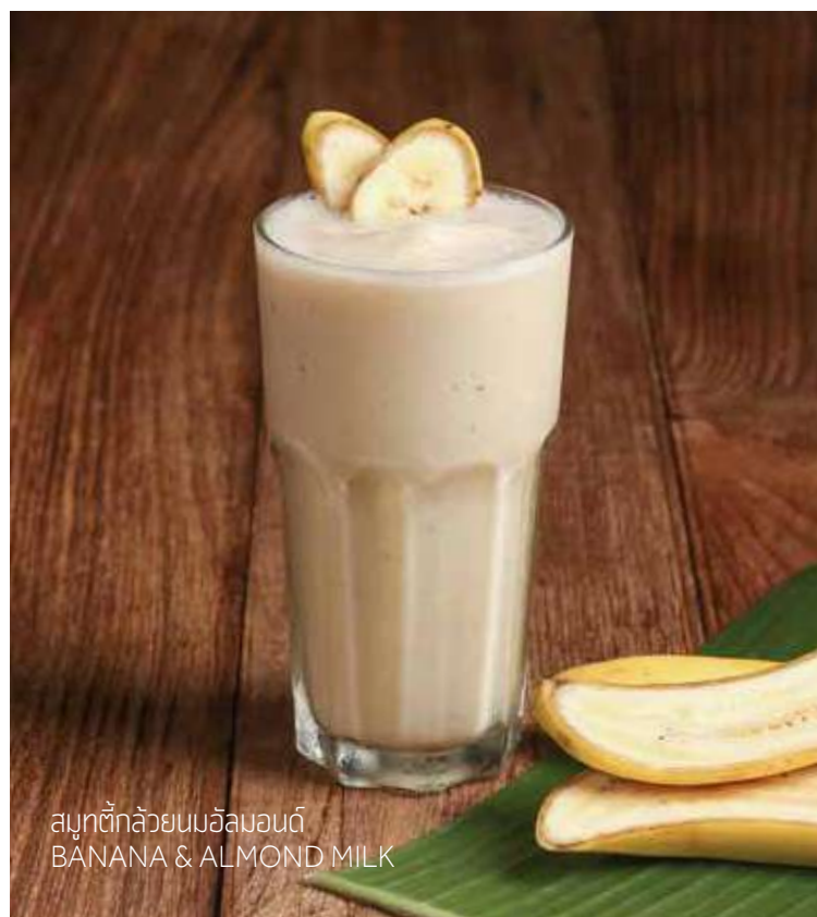
สมูทตี้กล้วยนมอัลมอนด์ BANANA & ALMOND MILK