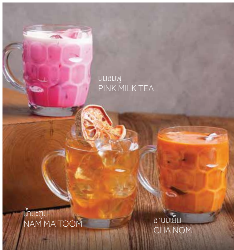
นมชมพู PINK MILK TEA