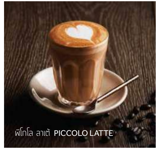
พิคโคโล ลาเต้ PICCOLO LATTE